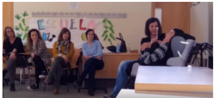
Universidad de Castilla La Mancha

Por ello, trabajamos sobre nuevos roles para las personas, que se han convertido en formadores de esta metodología en numerosos cursos, demostrando cómo poner la teoría del apoyo activo en la práctica.