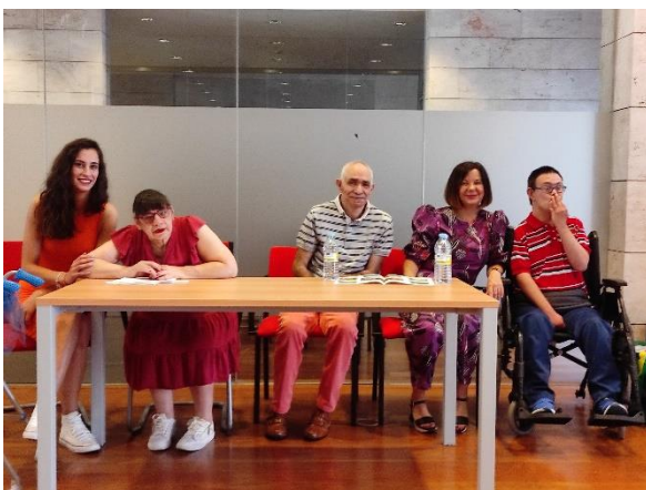
Consejería de Bienestar Social. Toledo